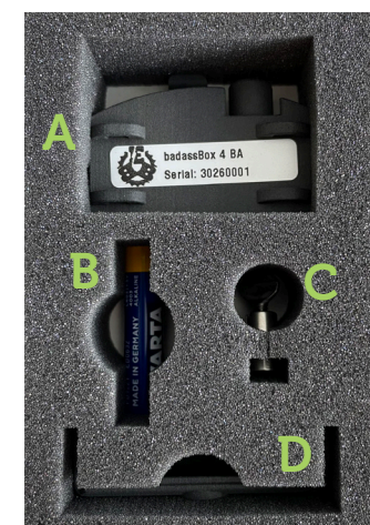
De inhoud van de badassBox.