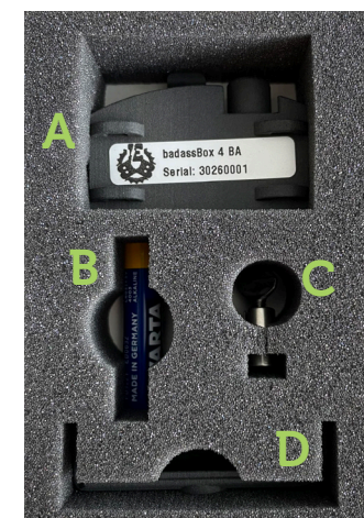
De inhoud van de badassBox.