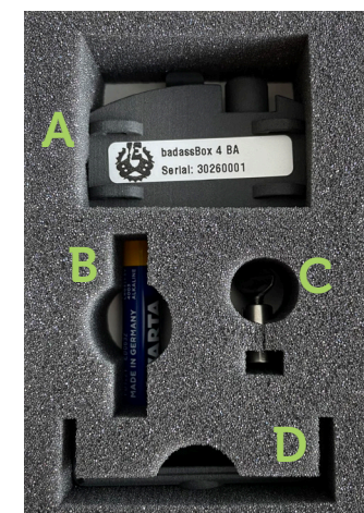
De inhoud van de badassBox.